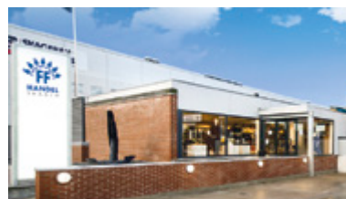
FF Handel servicerer trawlerne med supply og bunker døgnet rundt.