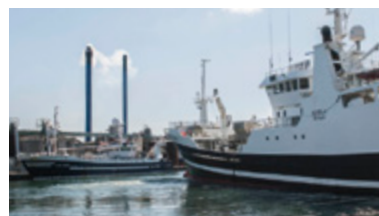
358.000 tons friske råvarer gik over kaj til FF Skagen i 2015.